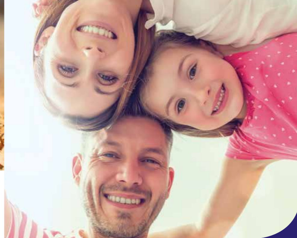
Photo Communication • Crédits photos : UEM Rémi Villegri - Adobe Stock